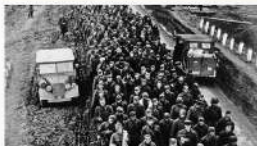
Остатки в Германии.