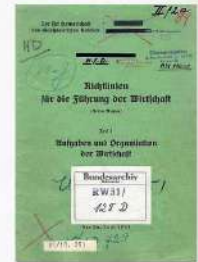
План «Ольденбург», 1941 год.

22 июня. Война на уничтожение. Ключевые точки исторической памяти