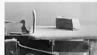
125 граммов – минимальная дневная норма пайки хлеба в самые тяжелые дни блокады Ленинграда.

▶ Более 4 000 100 человек погибло от голода в годы Великой Отечественной войны