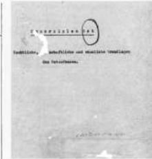
План «Ост» — план нацистской Германии, предусматривавший массовое уничтожение населения Восточной Европы и СССР.

22 июня. Война на уничтожение. Ключевые точки исторической памяти