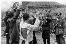
Захватчики на советской территории, 1941 год.

Из разговора с вице-премьером правительства Румынии и министром иностранных дел Михаэлем Айтонеску в Берлине 27 ноября 1941 года.