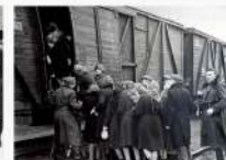
Угон населения СССР в Германию.

22 июня. Война на уничтожение. Ключевые точки исторической памяти