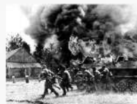
Наступление немецкой армии, июнь 1941 года.

22 июня. Война на уничтожение. Ключевые точки исторической памяти