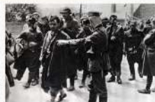
Фашистские оккупанты вывозят население СССР.